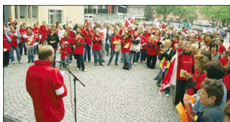
Kundgebung vor dem Rathaus: Rund 170 Erzieherinnen und Sozialarbeiterinnen demonstrierten für bessere Arbeitsbedingungen und einen Tarifvertrag zur Gesundheitsförderung