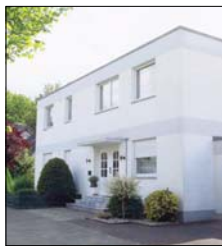
In diesem Haus an der Haselstraße wohnte das Opfer.