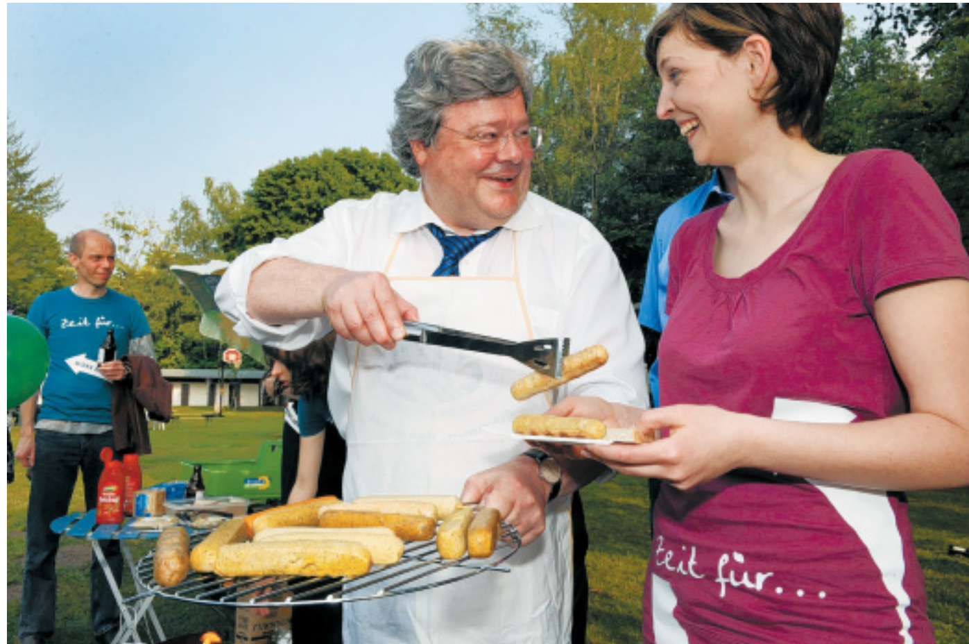
Extrawurst für Gleichgesinnte: Reinhard Bütikofer, Spitzenkandidat der Grünen für die Europawahl, serviert Bürgermeisterkandidatin Wibke Brems (Grüne) ein Tofuwürstchen. Die Politik stand beim Grillen im Wapelbad nur kurz im Vordergrund.