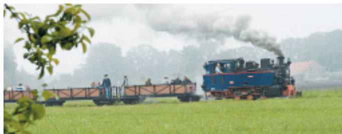
Saison eröffnet: Die Dampfkleinbahn Mühlenstroh (Baujahr 1942) startete vor malerischer Kulisse ins neue Fahrjahr.