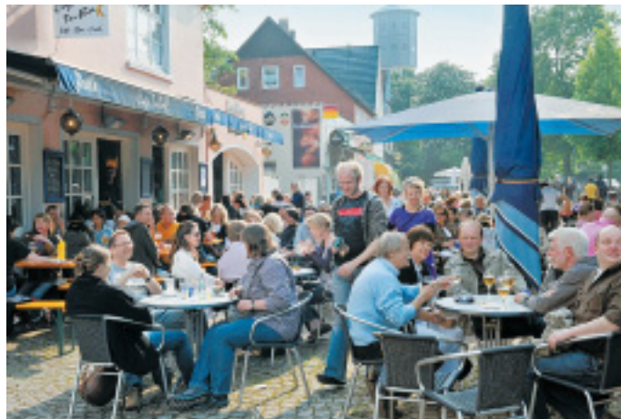
Volle Kneipenmeile: Am Dreiecksplatz genossen Gäste das sonnige Wetter.

Unterdessen lud die Kulturgemeinschaft Dreiecksplatz zur neuen Reihe „Freitag 18“ ein, die dort bis September an jedem Freitag um 18 Uhr Kleinkunst,